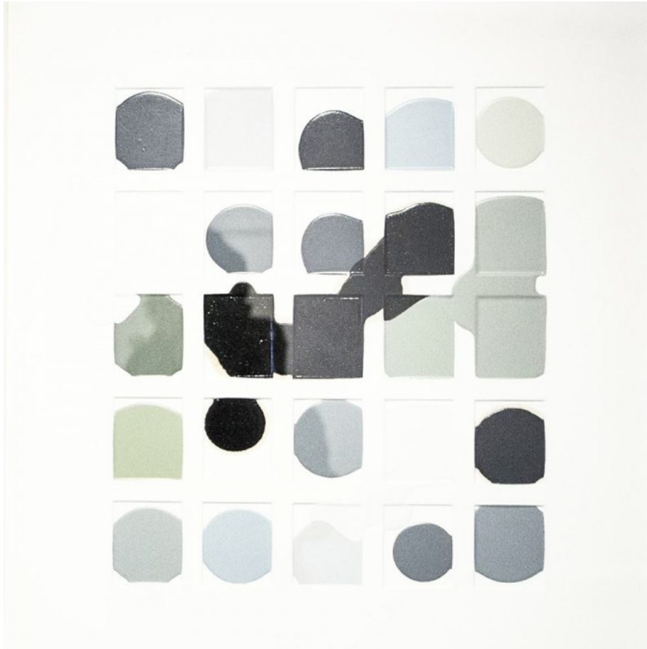
"Ensayo error", 2016. 59x64cm. Esmalte. Galería L&B

L: Has pasado una temporada viviendo en Berlín, ¿dónde estás afincado ahora?