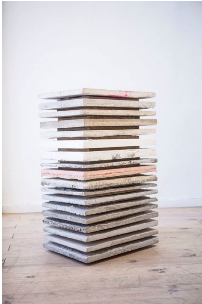
Créditos foto: Bruno Ollé. "R.A.L. hormigón", 2016. Galería L&B