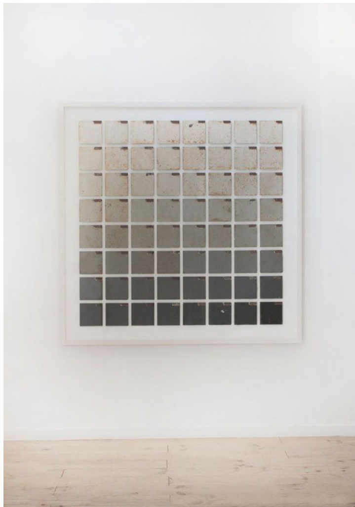
"Ensayo error", 2016. 160x160cm. Esmalte sobre hierro. Galería L&B

B: En principio no, depende del momento. Cuando pienso en un proyecto no pienso en pintura ni en escultura. En función de lo que se va haciendo, el propio proyecto me va llevando. En realidad, si uso pintura o escultura es porque pienso que es el mejor método para expresarme en ese determinado momento, pero lo cierto es que no hay ninguna disciplina en la que me sienta más cómodo.