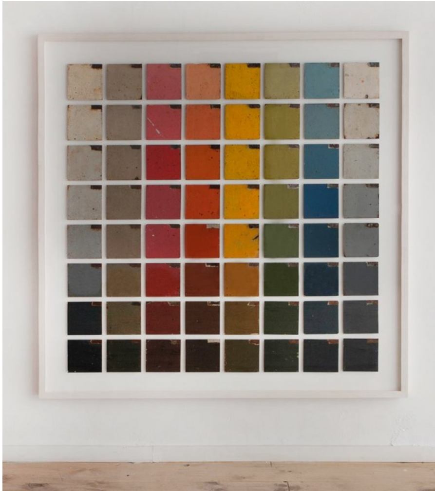
"Ensayo error", 2016. 160x160cm. Esmalte sobre hierro. Galería L&B