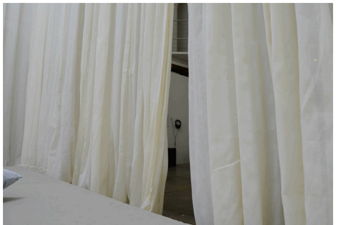
1-6. Instalación site-specific, luz y sonido, 2014.